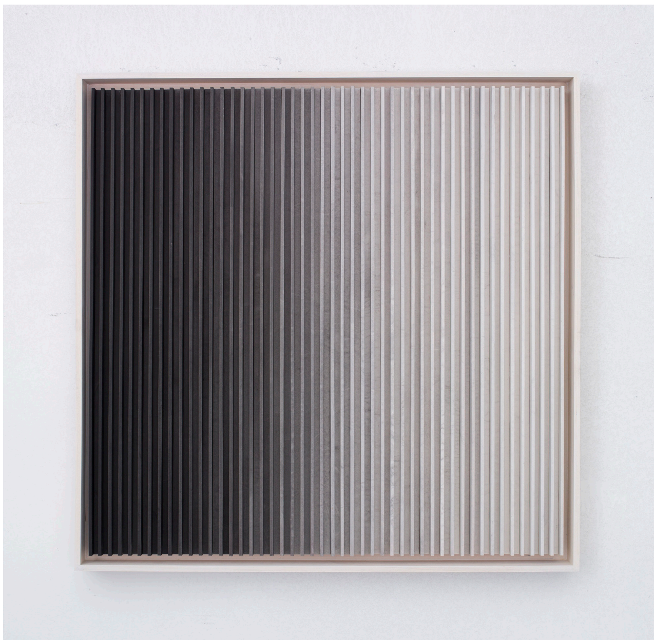
于羊, 50ml 墨和 2L 水 . A, 2015, 紙本水墨、木, 85 x 87 cm