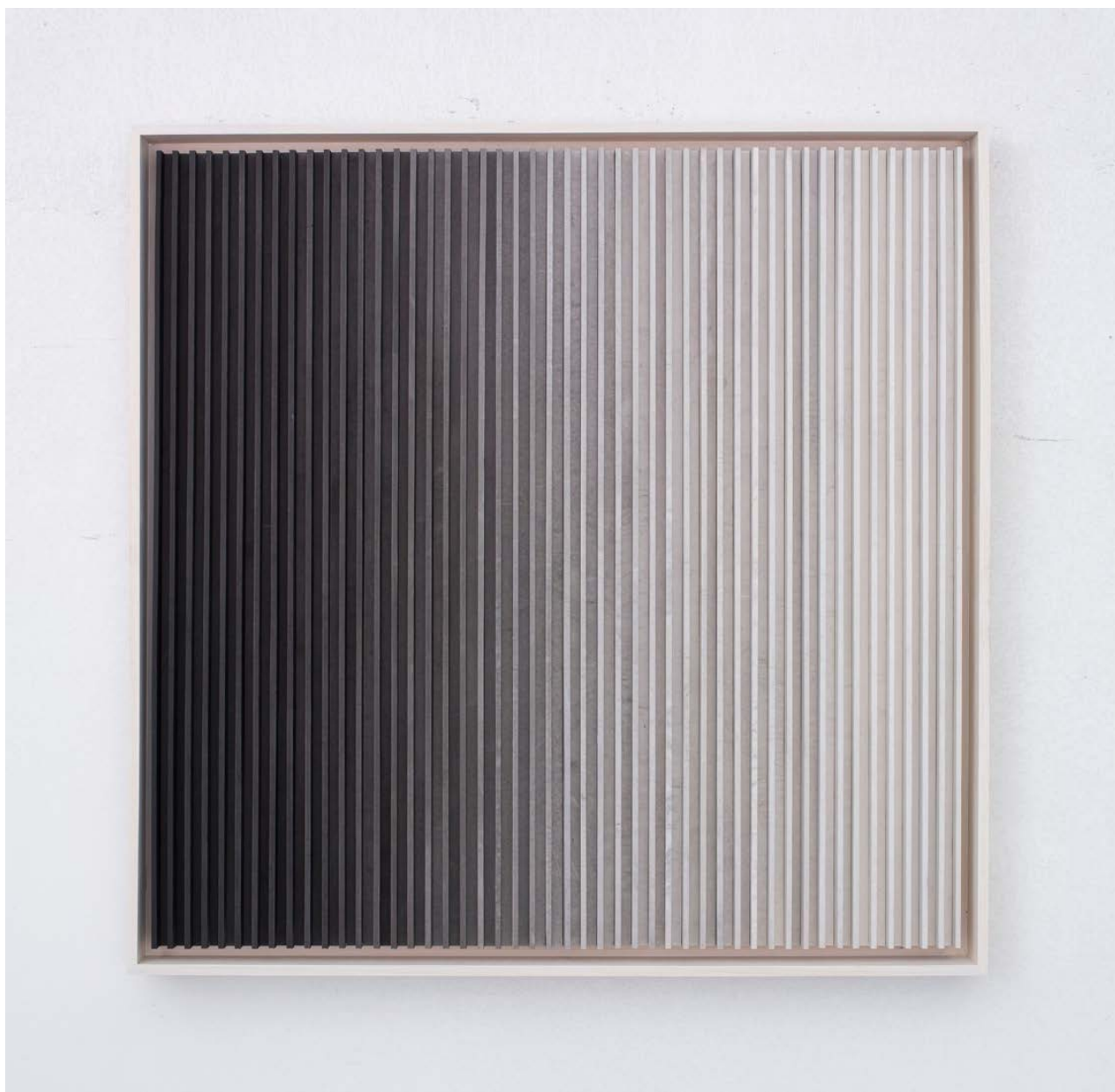
于羊, 50ml 墨和 2L 水 . A, 2015, 紙本水墨、木, 85 x 87 cm