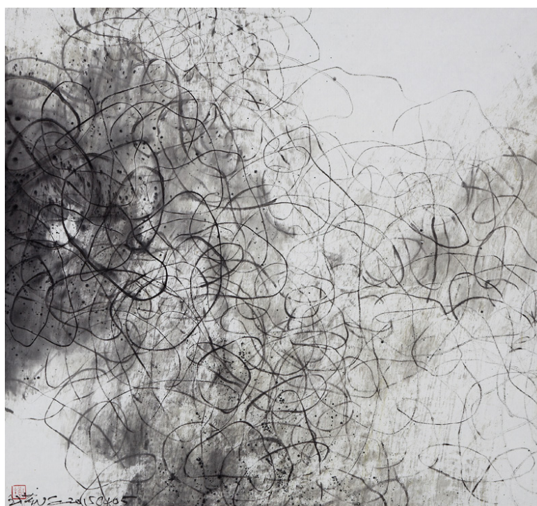
王璜生，游象 150405，2015，水墨紙本