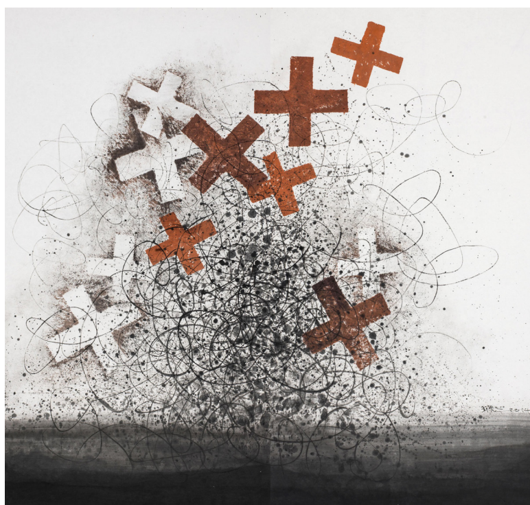
王璜生，箴象 2014，紙本設色拓印，2014，180 x 198cm

王璜生出生於書畫世家，其父親是嶺南畫派著名文人書畫家王蘭若。在其父親的教導下，王璜生得到十分正規而嚴謹的繪畫訓練，但他的作品仍然葆有靈氣，揮灑自如，行雲流水。從畫作的線條，水墨的點滴和滲透中，都可以看出王璜生深厚的訓練功底，同時讓人聯想到中國書法。他特意在保留這種傳統韻味的基礎上，大大注入當代藝術表現方式，以抽象的線條，在渾厚而恣意間創造一種獨特的個人風格。