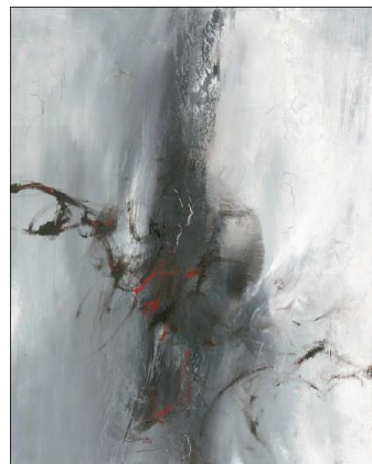
張淑芬，大音希聲，2018 布上油畫，80 x 100 cm