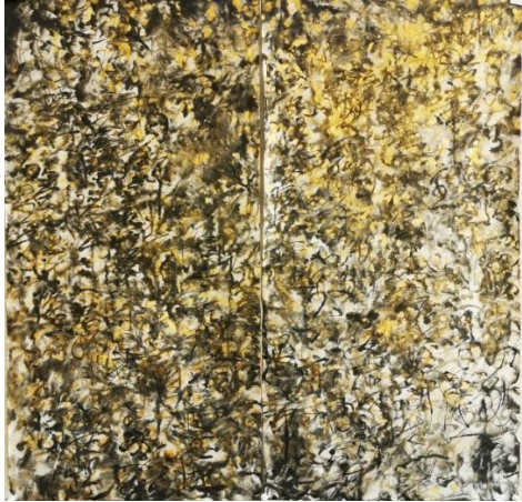
王璜生，日課•心經 191022，2019 紙本水墨設色 138 x 138 cm