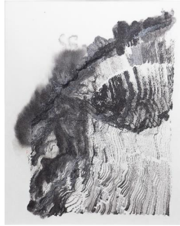
黃宏達，月球背面 0010，2019 人工智能水墨紙本，105 x 80 cm