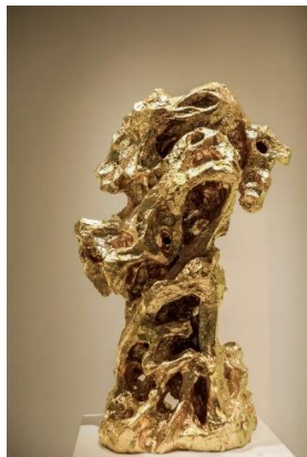
任天進，東風，2019 白銅、青銅著綠色、青銅 24K 鉑金貼金 58 x 52 x 120 cm, 180kg