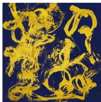
徐永進，寧靜熱情，2016 貝殼金粉、萬年藍宣，135 x 135 cm