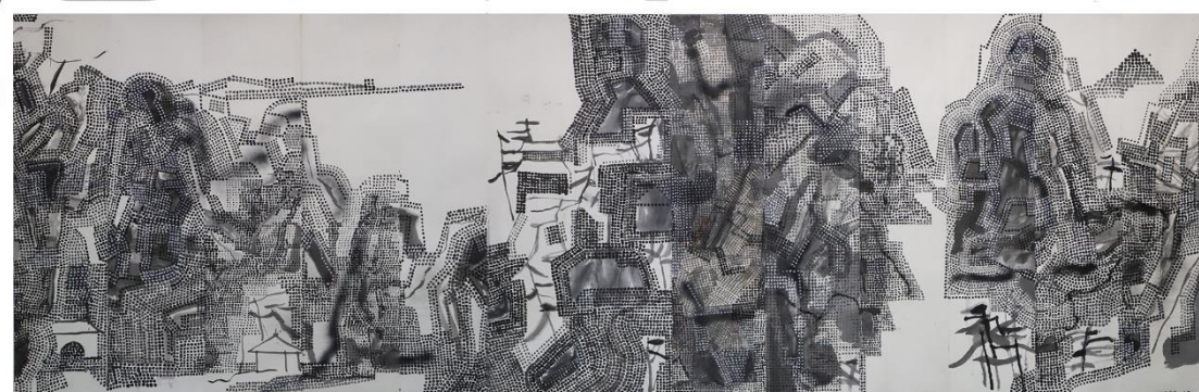
王劭音，江山勝景圖，2019 水墨紙本，136 x 426 cm