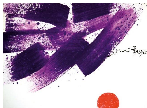
蕭勤，相傾，1966 紙上丙烯，38 x 51 cm