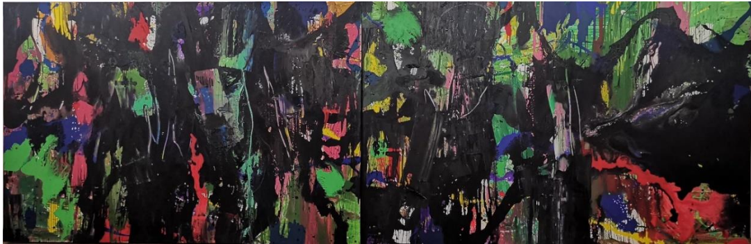
李磊，水問，2019 布上丙烯，200 x 300 cm x 2